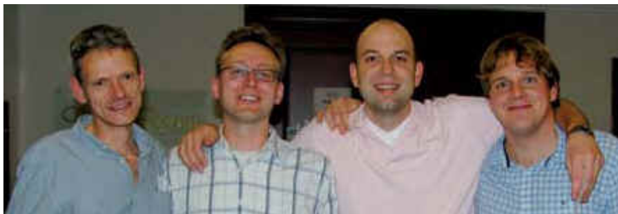
Team Onstein fra Nederland som vant Champions Cup

Det holdt til en KLAR seier . Det er mange som synes det er moro at også kaninen fikk over middels på en klubbkveld.