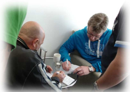
Ivrige Grandspillere etter 1 halvrunder