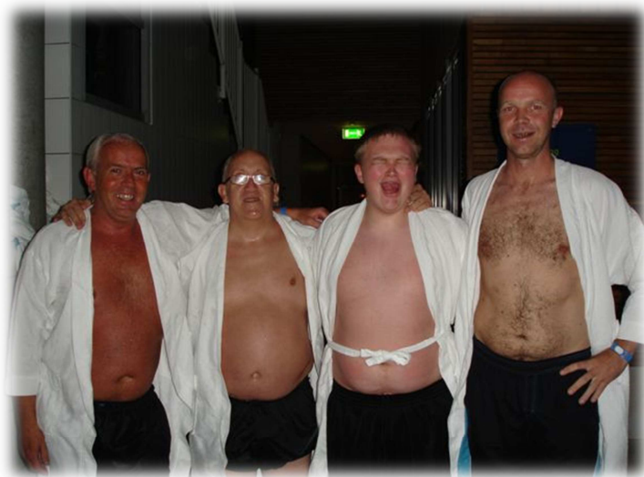
Noen av sjarmørene fra spa-bridge!

Dette blir selve manndomsprøven, særlig for de lagene med bare fire spillere. En svært interessant kamp mellom Studentene og Narvik 5 runde som vi fort får se i rama. Her er det bare å ståsette seg.