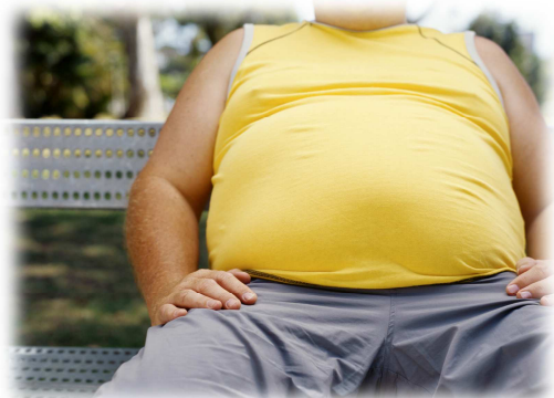
En typisk "bridgemave"!

Redaktøren er for ung, for tung, har feil antall mesterpoeng, men er nesten akkurat på gjennomsnittlig høyde! Hvordan ligger våre lesere an målt mot gjennomsnittet?